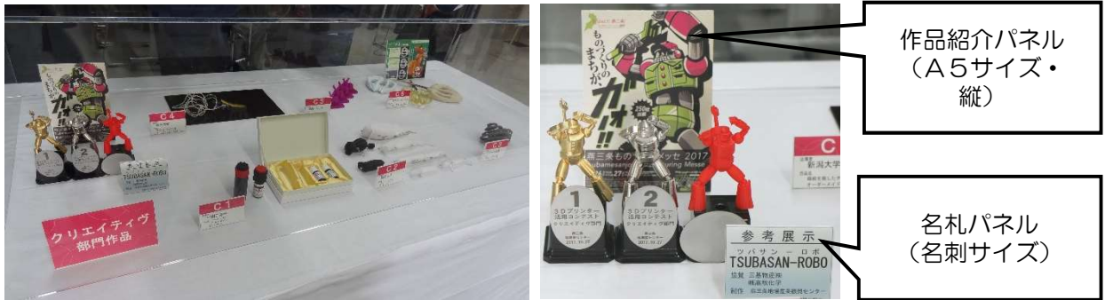
図1. 作品展示方法 (名札パネル、作品紹介パネル)