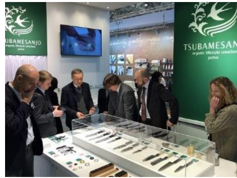
Ambiente 展示会 商談の様子