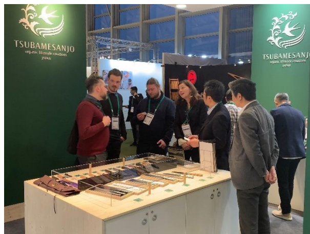
※前回 Ambiente2020 出展イメージ