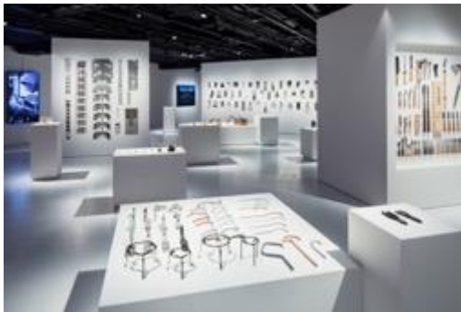
ジャパン・ハウス ロンドン(2018.9.5~10.28)