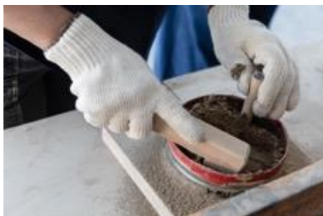
例) 鋳造体験(つくる体験)