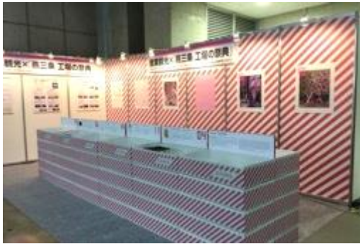
ツーリズム EXPO ジャパン(2016.9.23~25)