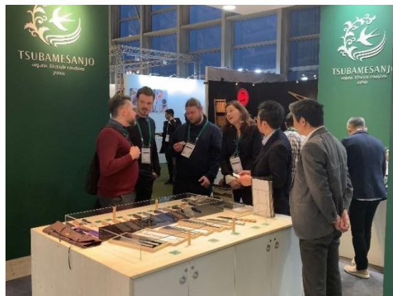
※前回 Ambiente2020 出展イメージ